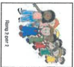
Illustration 2 page 2

JE ME RANGE DANS LE CALME ET JE NE CHAUTE PAS SUR LE TRAJET