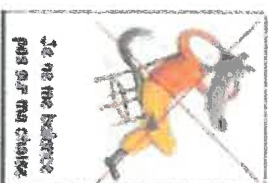
Je ne me balance pas sur ma chaise

JE M'ASSOIS ET ME TIENS CORRECTEMENT À TABLE